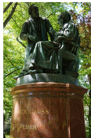
Figura 1: (a) La característica Pila del Ganso. (b) Gauss y Wilhelm Weber.

En otro cementerio, en el "Albanifriedhof", muy pequeño y más central, se encuentra la tumba de Johann Carl Friedrich Gauss (1777-1855), tal vez el mate-