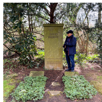
Figura 2: (a) Tumba de Gauss. (b) Tumba de Hilbert.

Así es como Felipe y yo visitamos las tumbas de Gauss, en el cementerio Al-