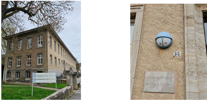
Figura 4: El Instituto de Matemática, en la calle Bunsenstrasse.

Cabe mencionar que el día anterior, Felipe y yo seguimos la ruta de Leibniz (Gottfried Wilhelm Leibniz, 1646-1716), en Hannover, C donde él trabajó por largo tiempo para la familia real. 4 Visitamos su tumba en la iglesia “Neustädter Kirche”; el “Templo de Leibniz” en el extenso parque que conduce a los hermosos jardines del Palacio Herrenhausen; una muy buena exposición sobre Leibniz, al parecer permanente, en el piso subterráneo de la casa central de la Universidad de Hannover; y también el friso en las murallas exteriores de la Nueva Municipalidad (Neues Rathaus). Ahí aparece Leibniz siendo coronado con laureles por la Princesa-Electora Sophia. Considerando que al funeral de Leibniz no asistieron más de dos personas, él merecía nuestra visita.